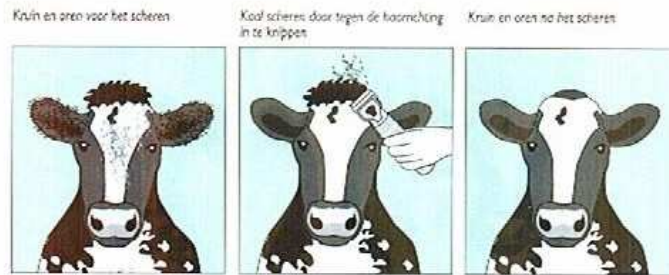
Kaal scheren door tegen de Haarrichting in te knippen